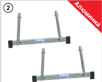
Узел TeleSet (2 шт.)