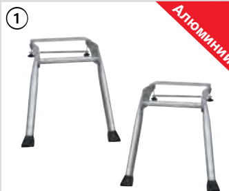
Узел BoardStand (2 шт.)