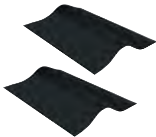
Комплектующий элемент NonSlip (2 шт.)