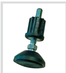
Регулируемые по высоте опоры предлагаются в качестве комплектующих устройств безопасности