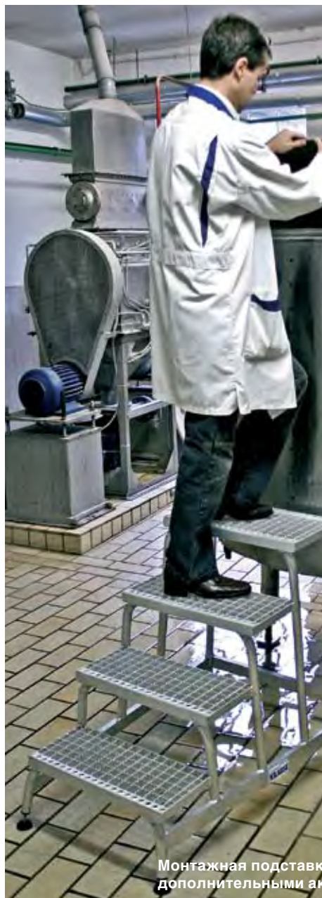
Монтажная подставка с дополнительными аксессуарами: 805 133