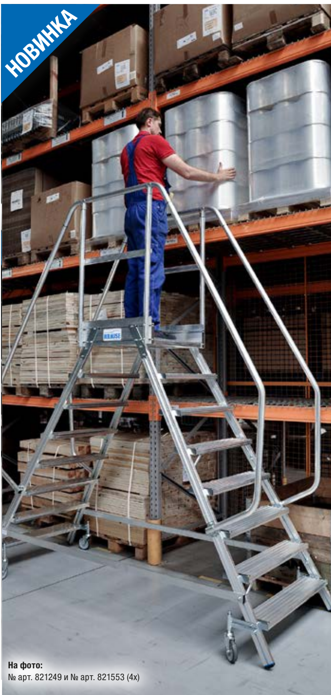
На фото: № арт. 821249 и № арт. 821553 (4x)