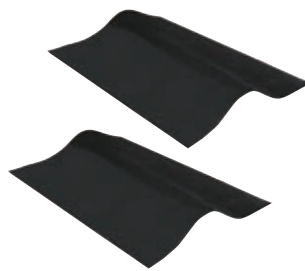
NonSlip (2 шт.) включены в поставку