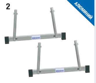
TeleSet (2 шт.)