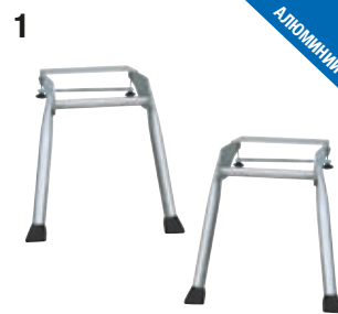
BoardStand (2 шт.)